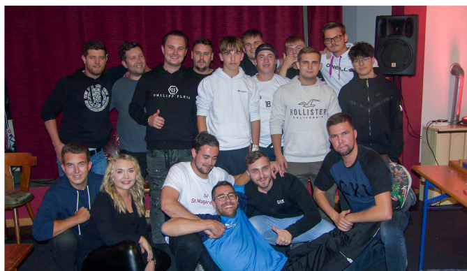
Die SJ vereinte Fußballer und Zocker bei einem Turnier.