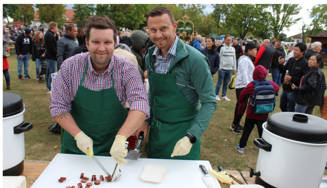
Die SPÖ beteiligte sich wieder am gut besuchten Erntedankfest.