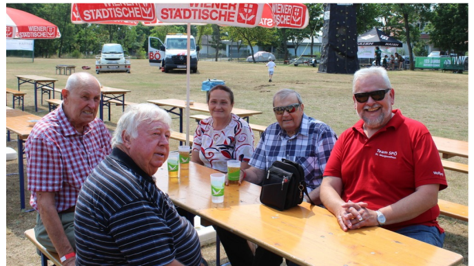
Das Familienfest bot auch Gelegenheit, gemütlich zu plaudern.