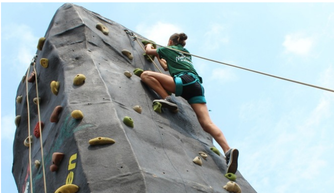
Hoch hinaus ging es auf dem Kletterturm der Naturfreunde.