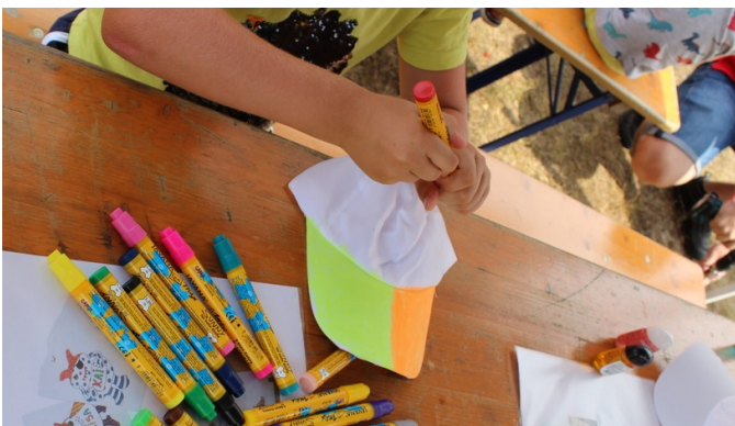
Kapperl anmalen durfte man bei der Kinderfreunde-Bastelstation.