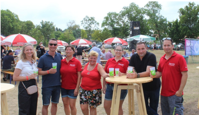
Alle freuten sich über ein gelungenes Fest und tolles Wetter.

Die vergangenen zwei Jahre waren für uns Magredarinnen und Magreda besonders bitter. Kaum eine Veranstaltung konnte in gewohnter Manier abgehalten werden. Der Kirtag, wie wir ihn kannten, fiel der Pandemie zum Opfer und konnte nur in abgespeckter Form stattfinden. An dieser Stelle ein großes Dankeschön an die helfenden Hände des Sportvereins SV Waha fix & fertig St. Margarethen, die für das leibliche Wohl sorgten. Die SPÖ St. Margarethen hat sich im vorigen Sommer – trotz der herausfordernden Umstände durch die Pandemie – für die Abhaltung des Familienfestes am Freizeitgelände entschieden. Bei bestem Wetter und unter Einhaltung aller damals gültigen Corona-Bestimmungen konnten wir generationsübergreifend ein wunderschönes Fest feiern. Hier ein paar Eindrücke: