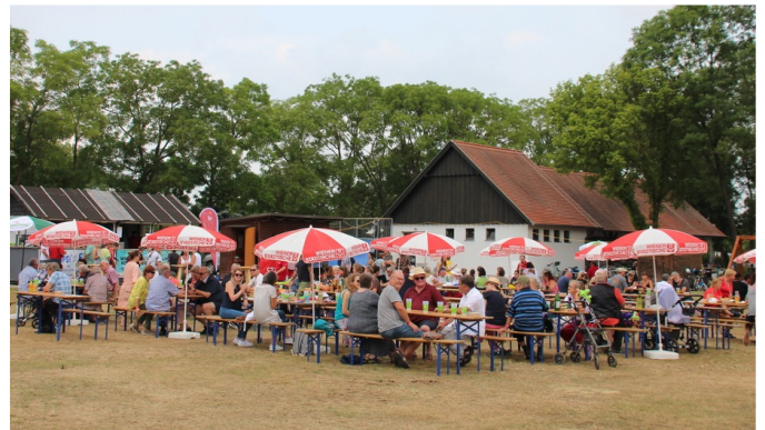
Zahlreiche Gäste kamen zum SPÖ-Familienfest.